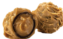
Мусс Соленая карамель