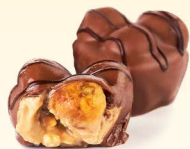
Пралине с карамелизованными орехами