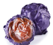
Трюфель черничный *