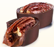
Шоколадный ганаш-крем с пеканом и карамелью