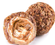
Трюфель со сливочно- кофейным ликером