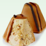
Тартуфо-мини в карамельном шоколаде*