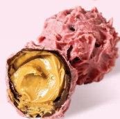
Трюфель с фисташкой и малиной