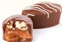
Пекан с карамелью