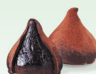
Трюфель с миндальным ликером*