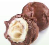
Трюфель со сливочным кремом