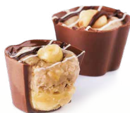
Шоколадный стаканчик с ореховым кремом*