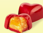
Красное сердечко (с ганашом манго-маракуйя)*