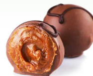
Трюфель с карамелью