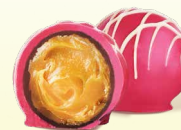
Трюфель манго- маракуйя*